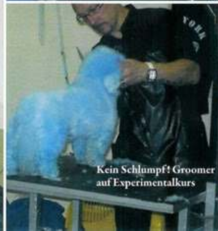
Kein Schlumpf! Groomer auf Experimentalkurs