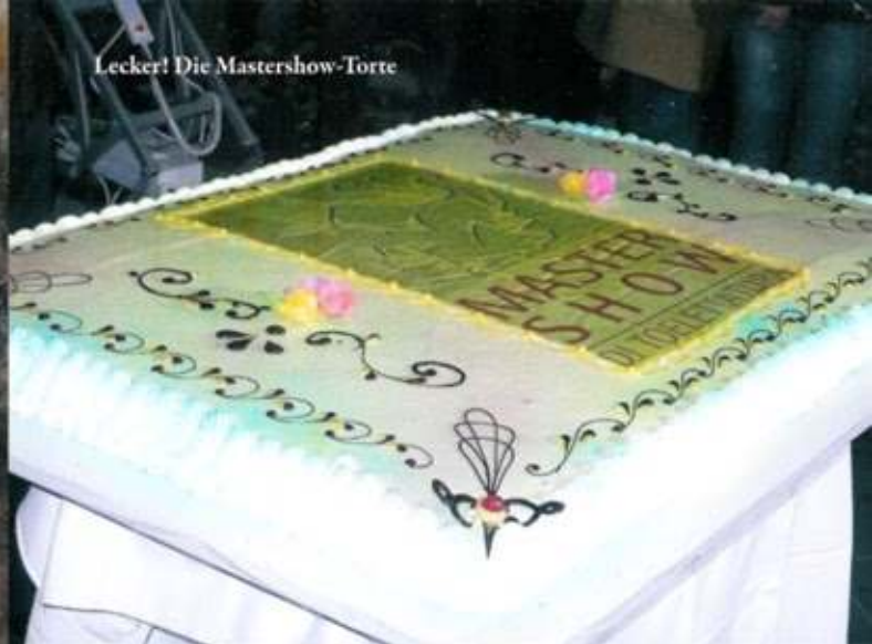
Lecker! Die Mastershow-Torte