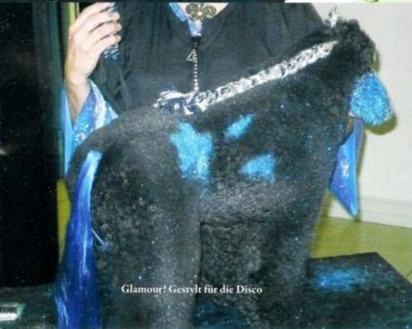
Glamour! Gestylt für die Disco