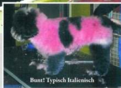
Bunt! Typisch Italienisch